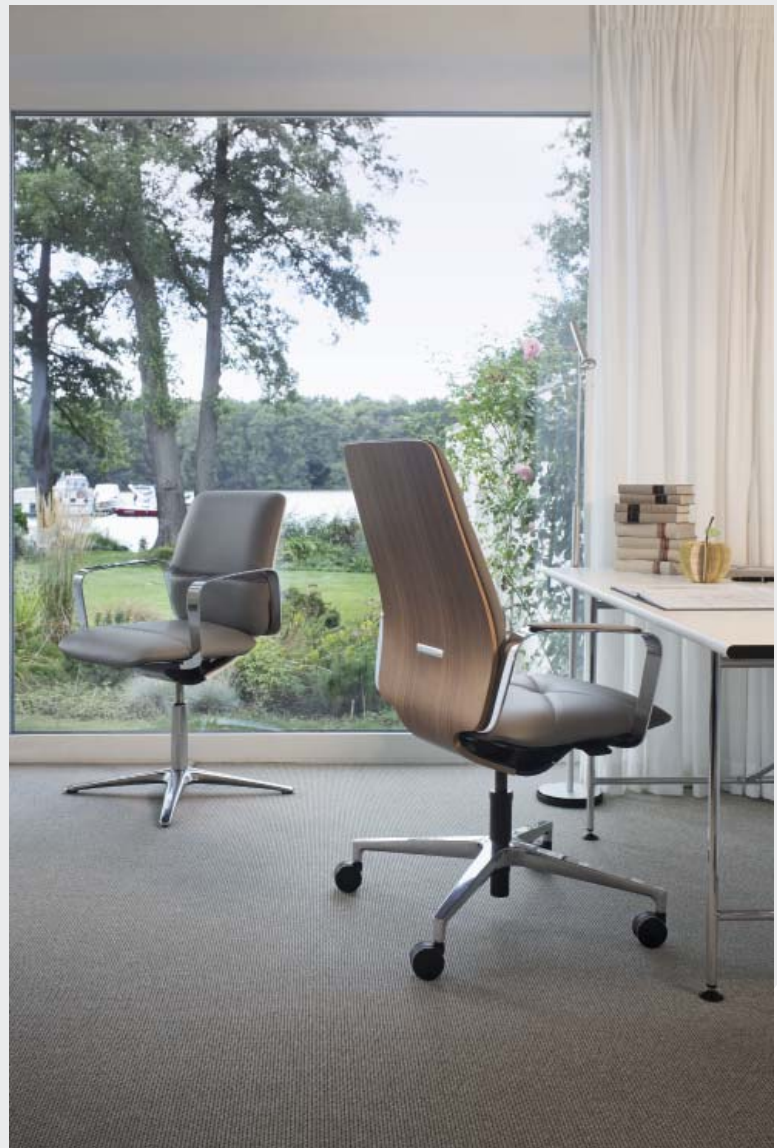
Design: Jörg Bernauer

ConWork holt mit Einfachheit die Natürlichkeit zum Sitzen zurück. Fließende Formen und klare Konturen prägen die Ästhetik des modernen Understatements. Die innovative Mechanik bietet hervorragenden Sitzkomfort in jeder Position. Sie kommt dabei ohne aufwändige Handhabung aus und brilliert mit den Materialeigenschaften der flexiblen Holzschale. Der technischen Erfindung folgt die minimalistische Gestaltung.